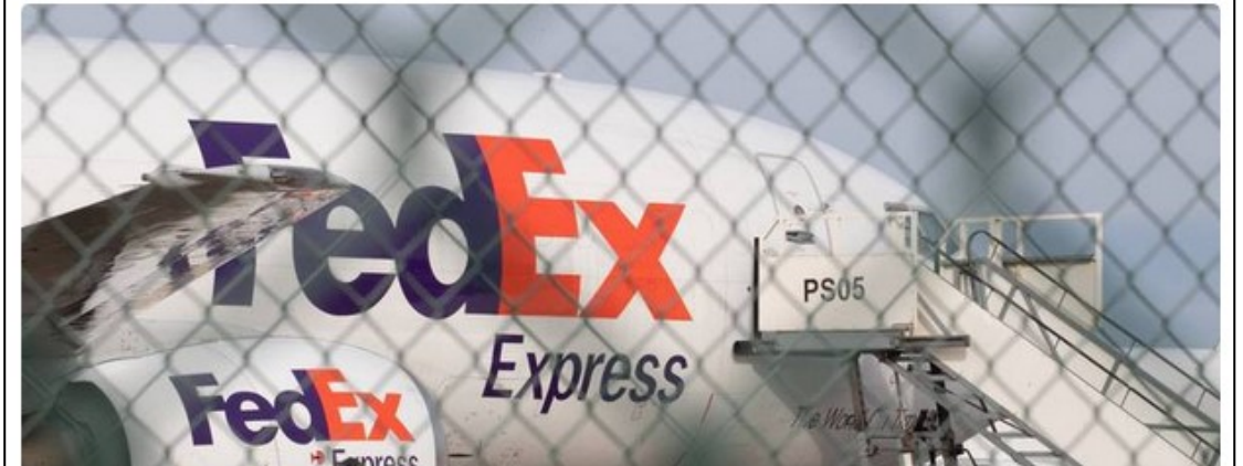
Capture d'écran  (22/01/2021)

Le secteur aérien est le grand oublié du plan de relance actuellement en discussions sur le plan des infrastructures publiques. Et l'annonce de FedEx à Liège n'arrange rien... La priorité, dans le secteur du transport, ira (largement) au ferroviaire.