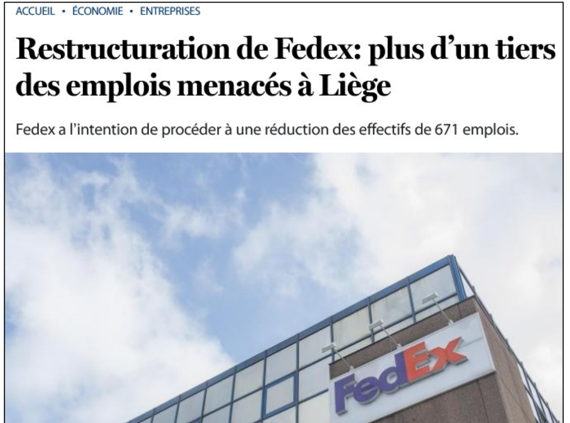
Capture d'écran (19/01/2021)